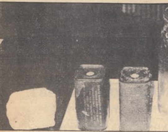
Από τα εκρηκτικά που βρέθηκαν χτες

Του ΑΝΤΩΝΗ ΡΕΝΙΕΡΗ κυβερνητικών κλιμακίων είναι πολύ σπάνια στην τοποθέτησή της - δεν αποφεύγει τους χαρακτηρισμούς (λ.χ. για «ανεπιθύμητο υλικό») και ούτε αφήνει περιθώρια για παρερμηνείες. Αναφέρει συγκεκριμένα: «Σε καμία περίπτωση η Πολιτεία δεν μπορεί να υποκαταστήσει στο έργο της από μεμονωμένες πράξεις ανεπίσημοι ιδιώτες. Ουδμία αυτοδικία θα επιτραπεί».