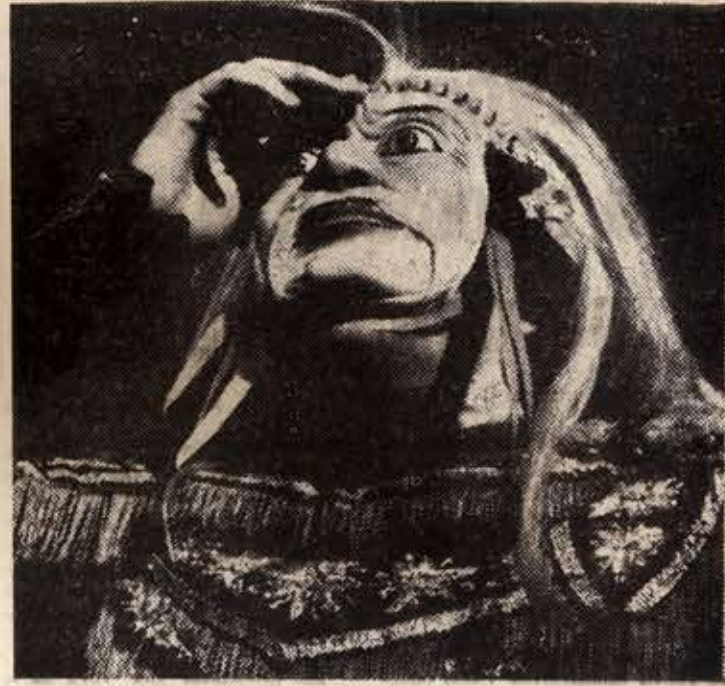
''Ηθοποιός του «'Οντίν» φορώντας μάσκα των Μπαλί.

ΤΟ «'ΑΤΡΟ 'Οντίν» ή πρώτη μεγάλη έγωση του, δεν είναι πολυπρόσωπο. Έκίνησε με τέσσερις ήθοποιους ή ά τώρα ή άριθμός τους σφέθηκε σε δέκα, που προ-