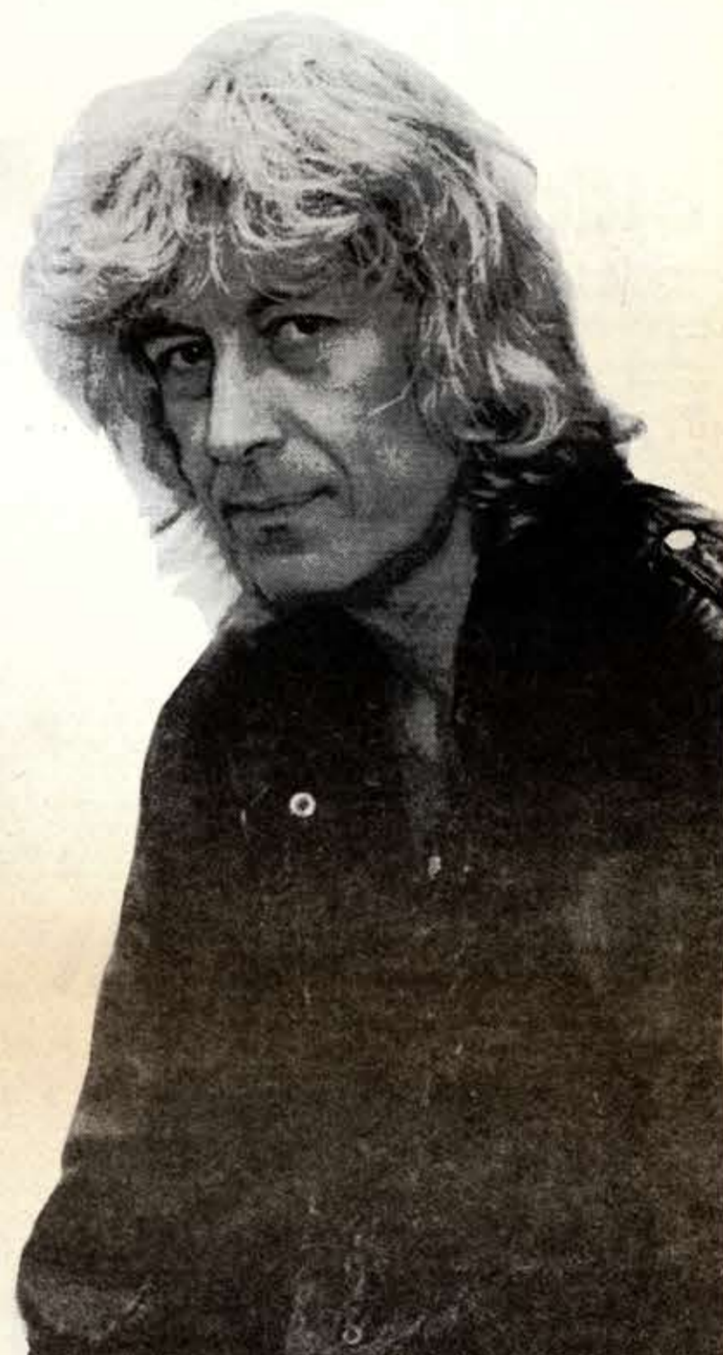
Κοντά μας σε λίγο καιρό ο Κελαηδόνης με την παράσταση "Αχ Πατρίδα μου γλυκειά".

Ανισχυώς οι καλλιτεχνες δεν μπορούν να αλλάζουν τον κόσμο. Αυτό που μπορούν να κάνουν είναι λίγο καλύτερους τους ανθρώπους. Δεν μπορούν να κάνουν τίποτα περισσότερο. Ας κάνει καλύτερα κάθενας την δουλειά του σωστά. Οση επιτυχία και αν έχουν οι συναυλίες δεν λίνονται τα Εθνικά μας θέματα.